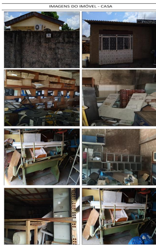
Figura 2 – Imagens do imóvel – (Casa).

Autorizada a entrada desta Administradora Judicial, fizemos a constatação do local, barracão e dos bens que lá se encontram, conforme se extraí das imagens abaixo: