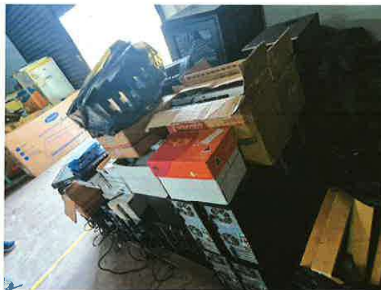
Foto 2 - BENS INSERVÍVEIS-LOTE DE BENS DE INFORMATICA.