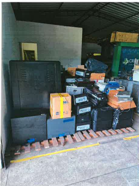
Foto 1 - BENS INSERVÍVEIS-LOTE DE BENS DE INFORMATICA.