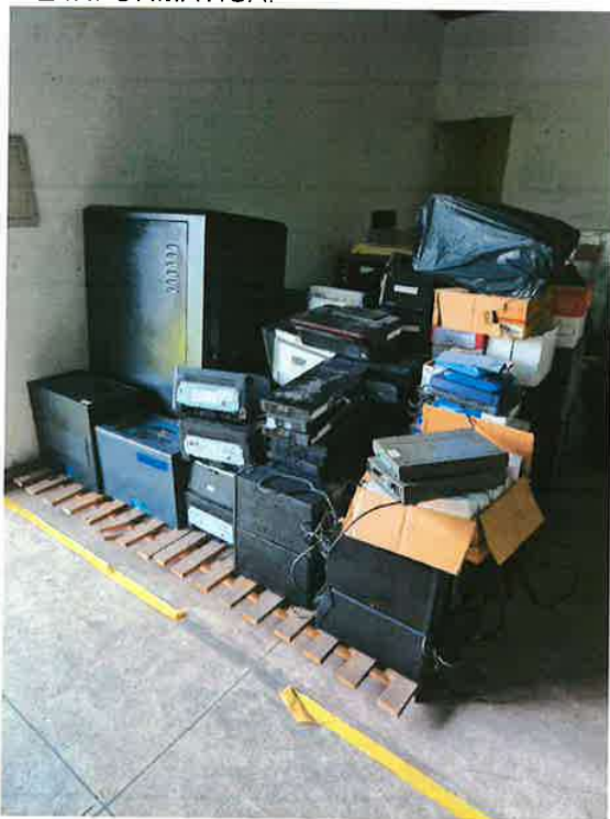
Foto 3 - BENS INSERVÍVEIS-LOTE DE BENS DE INFORMATICA.