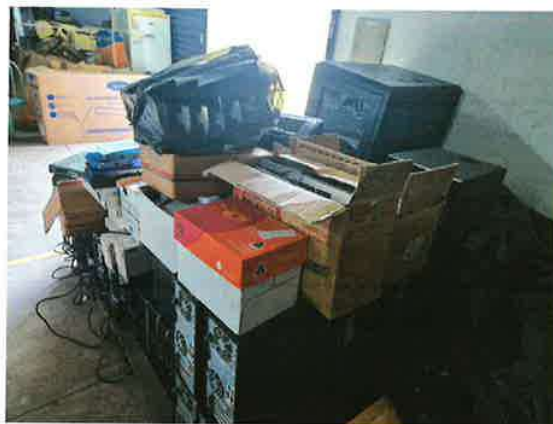
Foto 4 - BENS INSERVÍVEIS-LOTE DE BENS DE INFORMATICA.