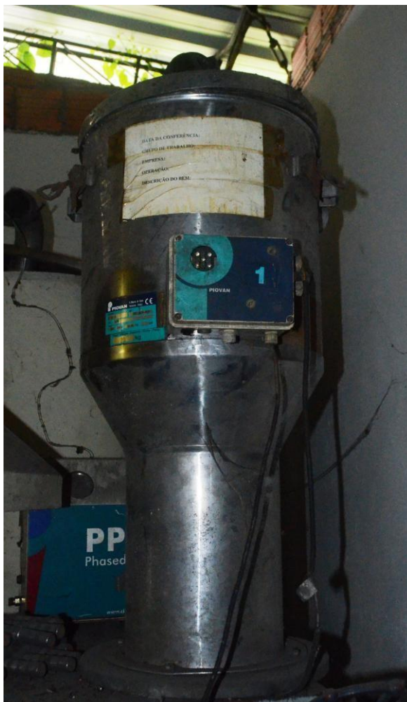
Figura 1: Aspecto geral do bem avaliado