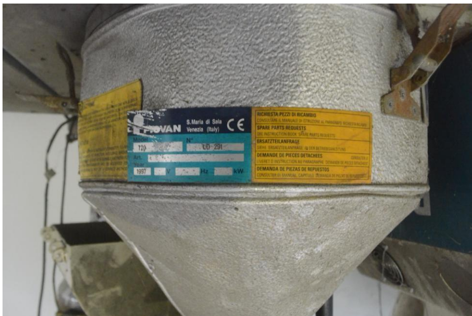
Figura 1: Aspecto geral Da unidade de secagem T20 N LD 291