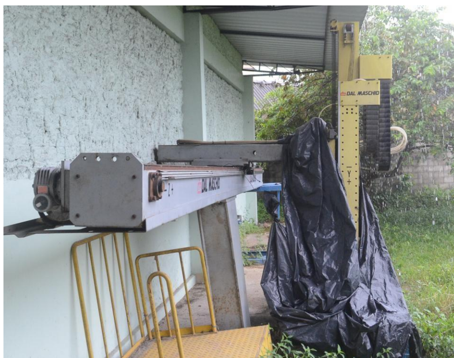
Figura 2: Aspecto geral do braço robô