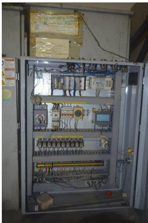
Figura 1: Aspecto geral do bem avaliado