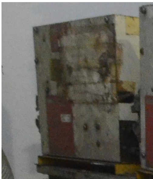
Figura 1: Aspecto geral do bem avaliado